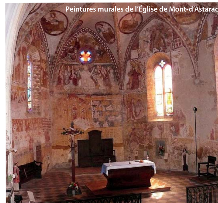
Peintures murales de l'Église de Mont-d'Astarac