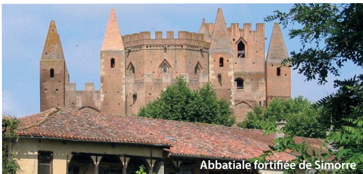
Abbatiale fortifiée de Simorre

Promenez vous d'églises en églises à la découverte des peintures murales et des sculptures du sud du Gers. Les édifices religieux que vous découvrirez datent du XIIe au XIXe siècle. Une partie de cette route est née de la volonté d'un groupe d'habitants de l'Astarac à mettre en valeur les richesses patrimoniales de leurs chapelles et églises, toutes connues pour leur remarquable décor peint. Cette tradition picturale remonte aux alentours du XIVe et XVIe siècles.